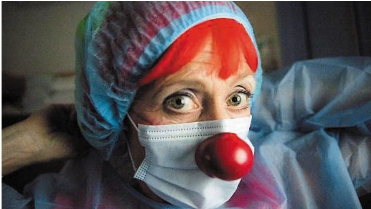
C'est le grand retour des clowns dans les hôpitaux pour les enfants malades.